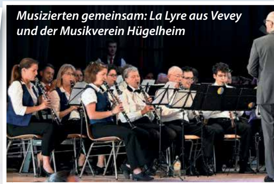
Musizierten gemeinsam: La Lyre aus Vevey und der Musikverein Hugelheim