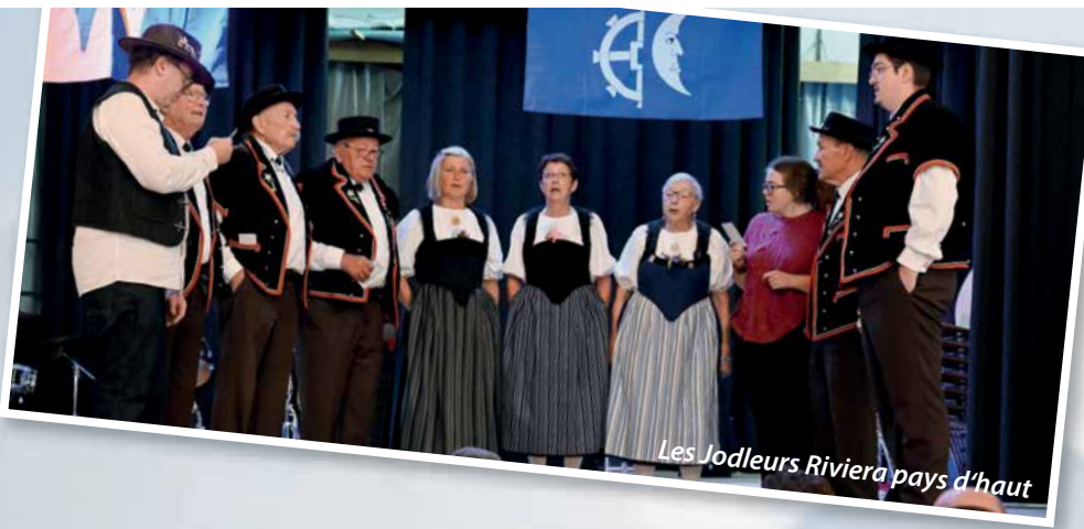
Les Jodleurs Riviera pays d'haut