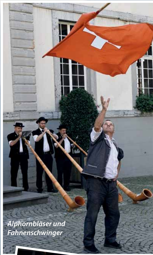
Alphornblaser und Fahenschwinger

rund 90 Personen an die Uferstadt des Lac Lemman. Die Offiziellen beider Stadte unterstrichen den Wert der Freundschaft auch fur die kommenden Generationen.