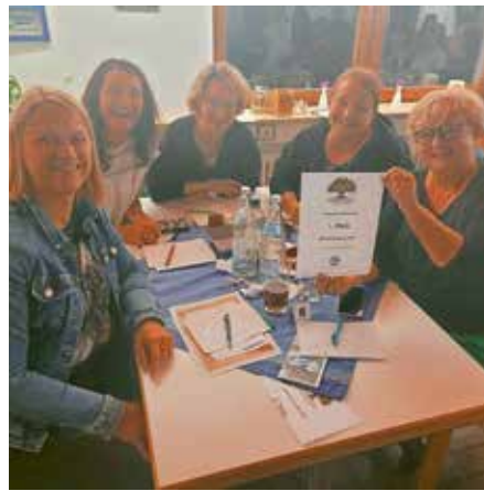
Das siegreiche Team der Damen von „In Trance“