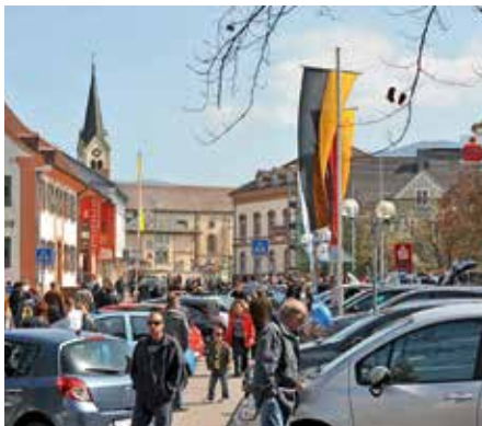
Volle Werderstraße am verkaufsoffenen Sonntag mit Herbst-Autoschau in Müllheim.

Doch nicht nur die Bummler und Käufer sind an diesem Sonntag in Müllheims City gut bedient. Wer die müden Füße nach erfolgreichem Beutezug ausstrecken möchte, entspannt sich beim Einkehrschwung mit Kaffee, Viertel oder einem Vesper in den hiesigen Gasthäusern, Restaurants und Cafés. Dort kann der Gast – wie auch in den Geschäften – auf guten Service im Verwöhnformat setzen. Oder er stärkt sich mit einem raschen Imbiss von einem der Verpflegungsstände der Vereine.