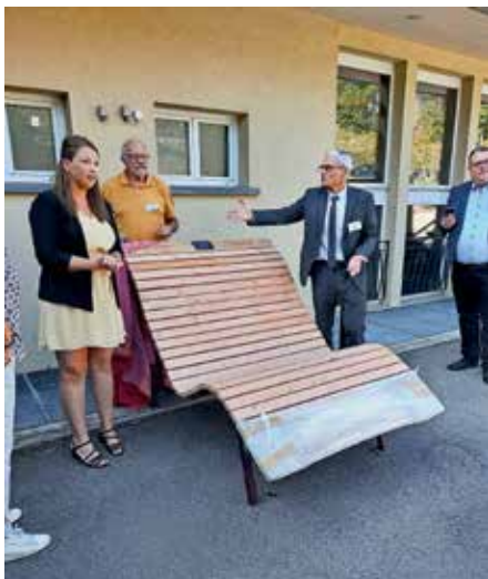
Himmelsliege mit Plakette

Eine Delegation aus Müllheim fuhr am 30.9.nach Vevey. Komitee, Förderverein, Bürgermeister u. Kulturdezernent u.w. Gastgeschenk war eine Himmelsliege.